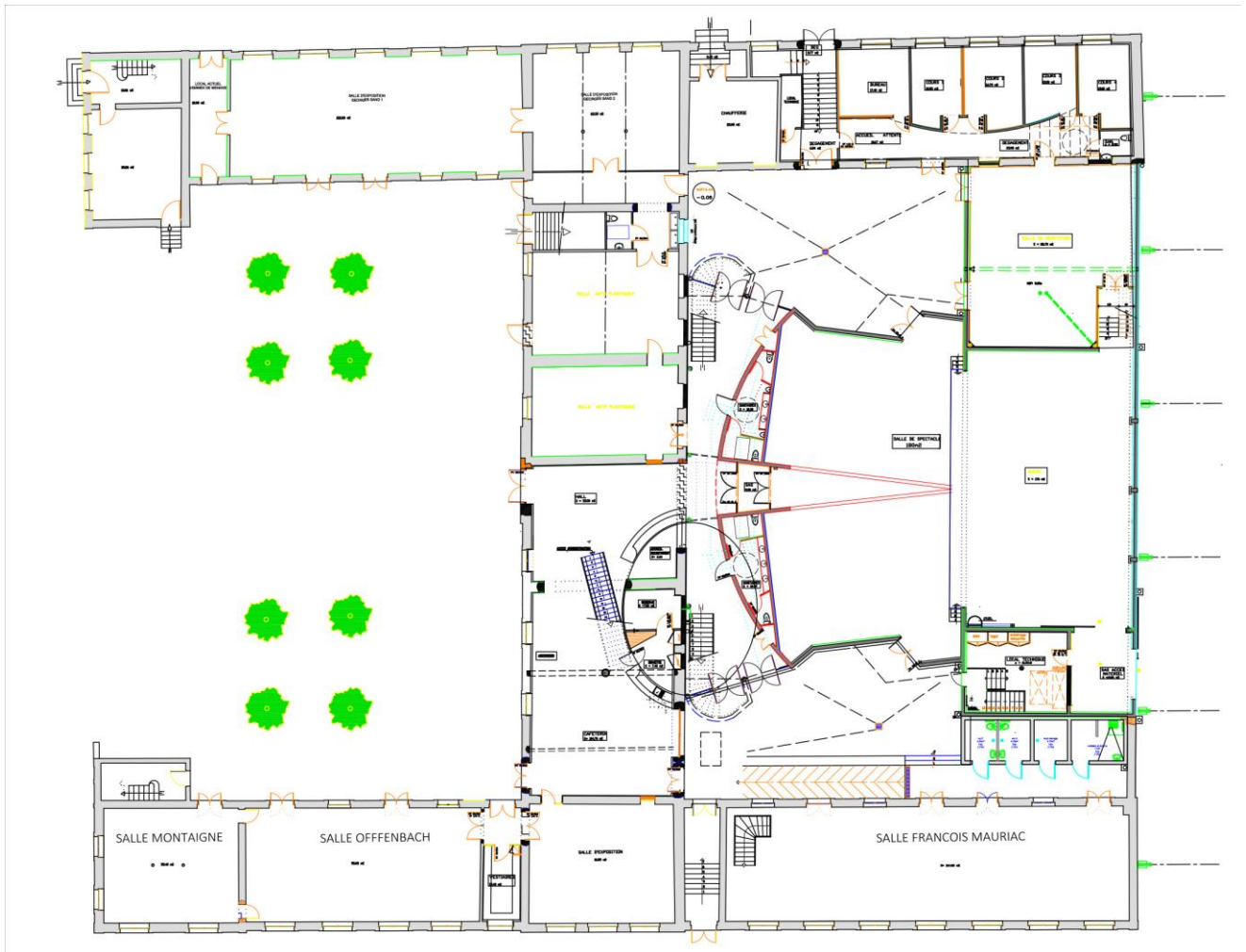
Plan du rez-de-chaussée du Centre culturel des Carmes

Détail des locaux concernés dans le cadre de l'Appel à Projets : 2 salles d'arts plastiques, 1 sanitaire, un point d'eau