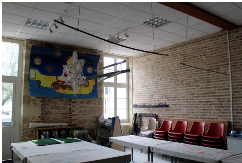
Salle de cours