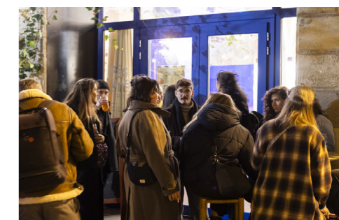
Rencontre régionale des acteurs des arts plastiques et visuels 2025 à Bordeaux