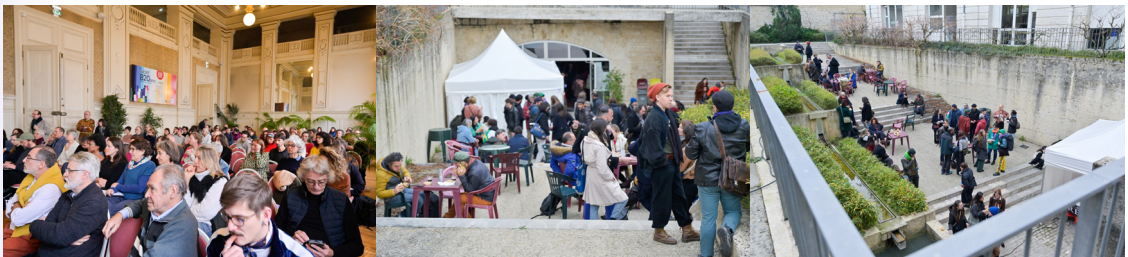
Rencontre régionale des acteurs des arts plastiques et visuels 2024 à Niort

Réunions préparatoires sur place : 23 janvier - 14 février - 27 mai