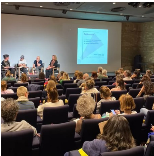
19èmes rencontres nationales inter-associatives de la fraap à Bordeaux

La coopération entre les deux équipes a consisté en la mise en lien avec les partenaires locaux institutionnels et professionnels, coordination partagée sur la communication, sur les thèmes des tables-rondes et leur animation.