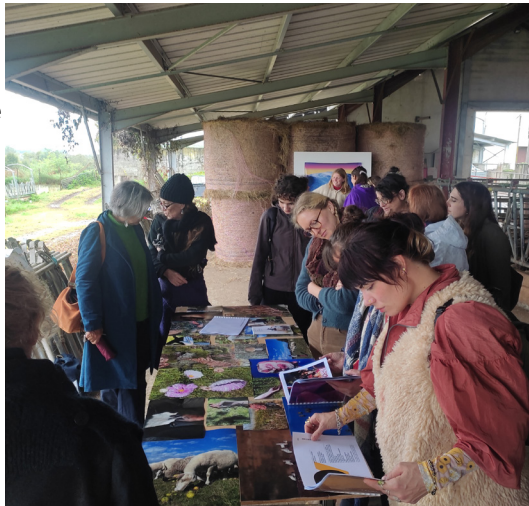
"Artistes en territoire paysan", rencontre organisée par la prairie des possibles à Lys, le 2 octobre 2024.