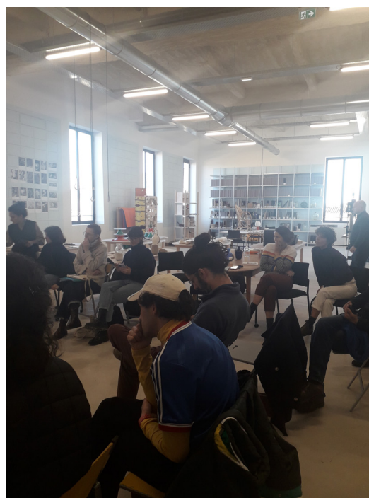
Les lieux de résidences néo-aquitains rencontrant la cité internationale des arts, le 15 novembre 2024, à la Fondation d'entreprise Martell à Cognac.