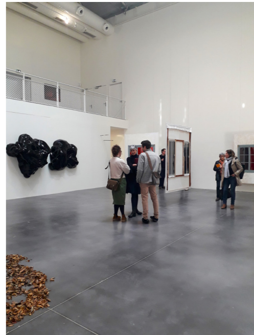
Astre au FRAC Poitou-Charentes à Angoulême le 27 mars 2023

En octobre, au sein d'une discussion du Conseil d'Administration, il est apparu nécessaire de préciser les objectifs fixés au sein du groupe de travail. Avec d'une part, la volonté de réaliser un événement dans le but de générer de la visibilité pour le secteur des arts plastiques et d'autre part dans une volonté de faire évoluer nos pratiques vers un paradigme de l'écoresponsabilité. De fait, en l'état nous réalisons qu'il est compliqué de concilier les deux, c'est pourquoi le conseil d'administration a souhaité mettre ce groupe de travail à l'arrêt et envisager ce chantier à l'aune des actions prioritaires qui seront définies par le projet associatif en 2024.