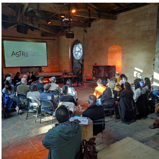
Assemblée générale de Astre aux Vivres de l'art à Bordeaux, le 7 avril 2023