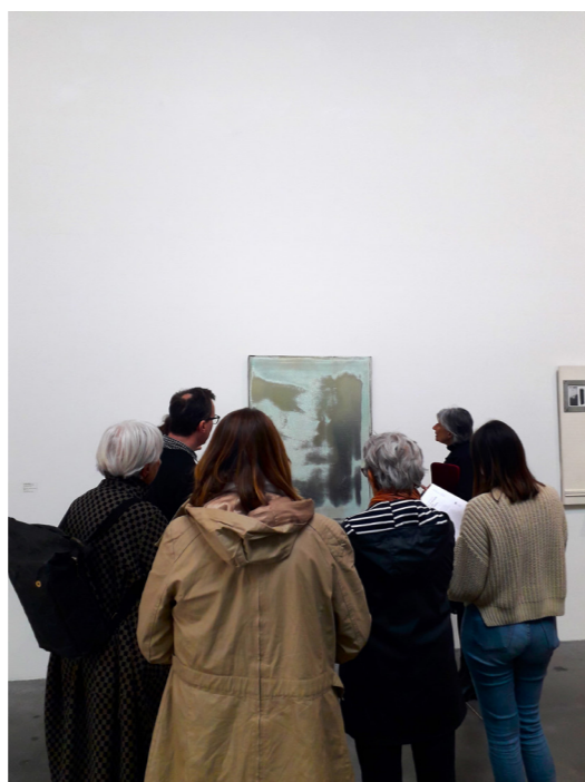
Astre au FRAC Poitou-Charentes à Angoulême le 27 mars 2023