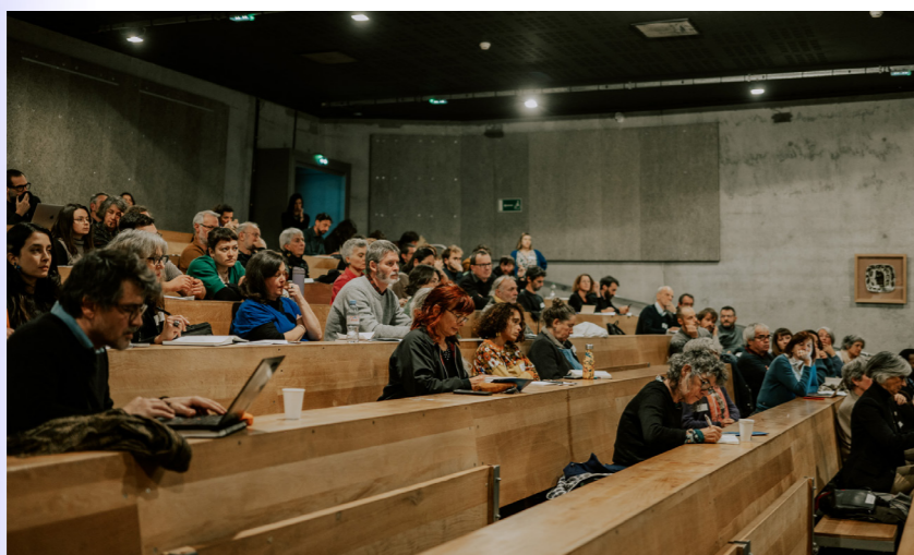
La rencontre régionale 2023 à Limoges, les 28, 29 et 30 novembre

« Recrutement / Compétences » ; « Observation / Anticipation » ; « Difficultés de recrutement / besoins en compétences » ; « Anticipation des mutations / observation »