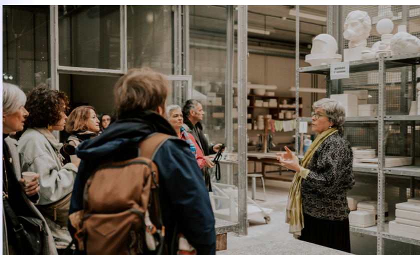
La rencontre régionale 2023 à Limoges, les 28, 29 et 30 novembre