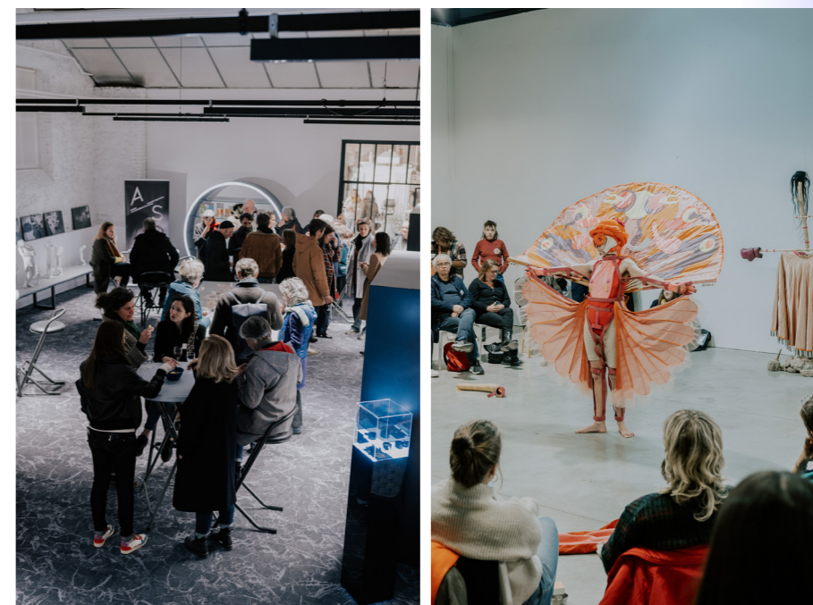
La rencontre régionale 2023 à Limoges, les 28, 29 et 30 novembre

>>> Consulter le cahier de la rencontre régionale 2023 : "Transmettre, accompagner : une responsabilité partagée"