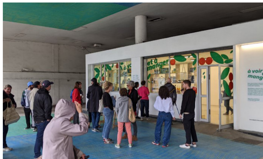
Journée professionnelle "A voir et à manger", le 1er juillet à Bayonne