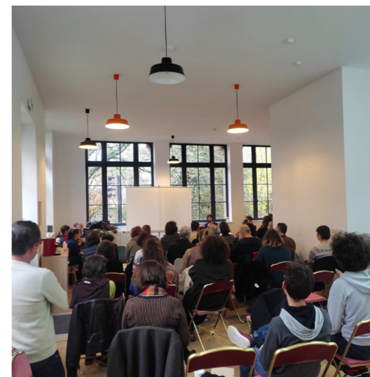
Astre au Musée national Adrien Dubouché à Limoges, le 30 novembre 2023 à la suite de la rencontre régionale.

Cette démarche de clarification de notre communication avec des chiffres-clés n'a pas aboutie. Le travail d'enquête en 2022 et la relance en 2023 ne permet pas de tirer des conclusions satisfaisantes avec un taux de réponses de l'ordre de 53 %.