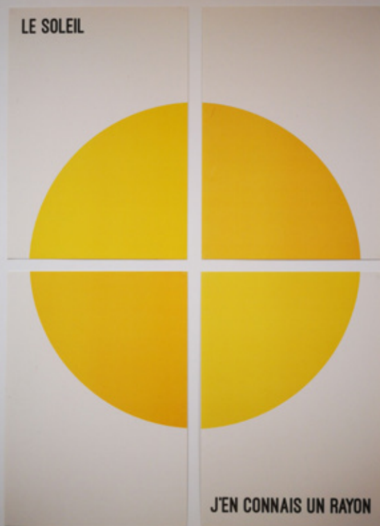
Résidence Louis Zerathe Exposition « Lieux communs » - 2021

École municipale des Beaux-Arts Collège Marcel-Duchamp 10-12 place Sainte-Hélène 36000 Châteauroux Tél. 02 54 22 40 20 embac@ville-chateauroux.fr embac.ville-chateauroux.fr