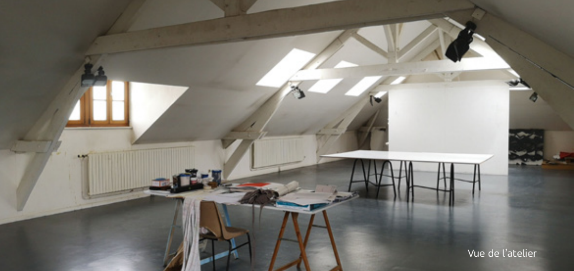
Vue de l'atelier